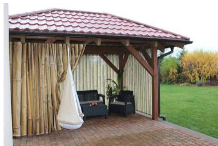
Rysunek 1. Kurtyna altanowa