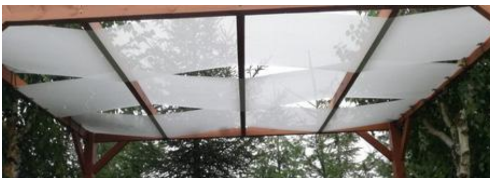
Rysunek 2. Proponowany sposób montażu pasów.