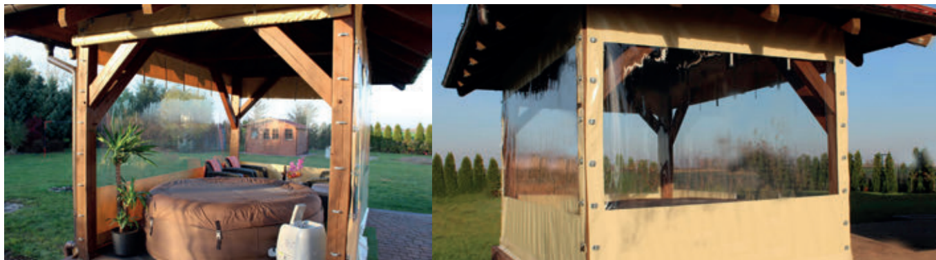
Rysunek 1. Oszona tarasowa z PVC, a) zrolowana b) rozłożona