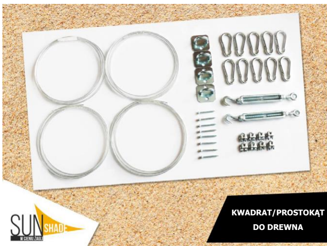
KWADRAT/PROSTOKĄT DO DREWNA