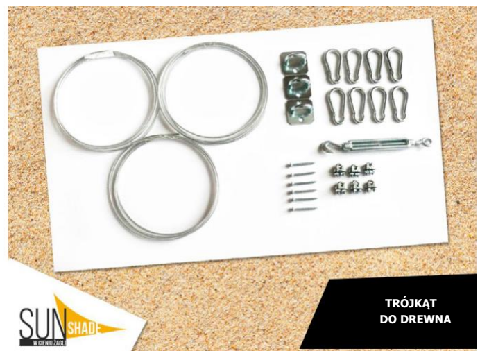
TRÓJKĄT DO DREWNA