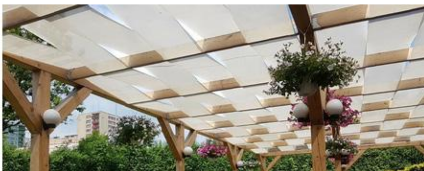
Rysunek 1. Pasy altanowe na konstrukcji.