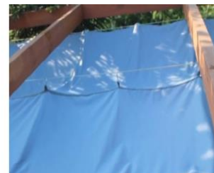
Rysunek 1c. Góra żagla rozsuwanego na 3 linkach