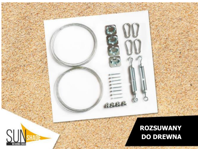
ROZSUWANY DO DREWNA