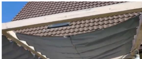
Rysunek 1b. Żagiel rozsuwany na 2 linkach