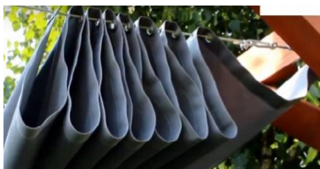
Rysunek 1b. Żagiel rozsuwany na 2 linkach