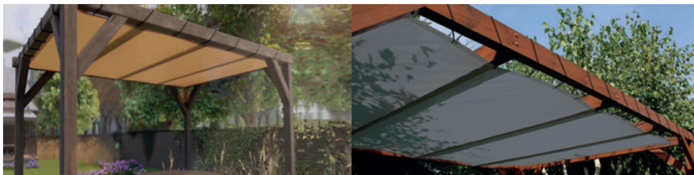
Rysunek 1. Dach żąglowy na konstrukcji