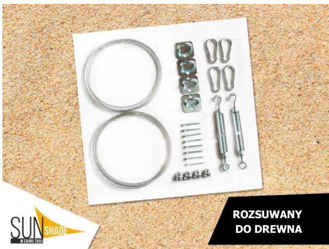
ROZSUWANY DO DREWNA