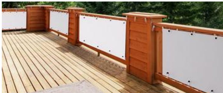
Rysunek 1. Osłona balkonowa