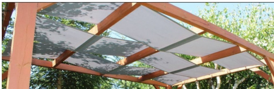
Fig. 1 Bandes gazébo/romaines en Premium Decor