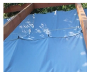
Rysunek 1c. Partie supérieure de la voile ouvrante sur 3 fils