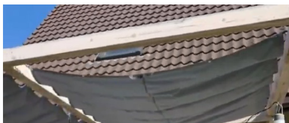
Fig. 1b Voile ouvrante sur 2 fils