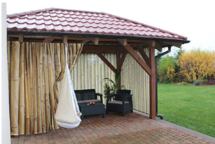
Abb. 1. Pavillon-Vorhang